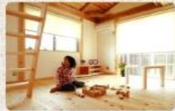
松が薫るキッズルーム