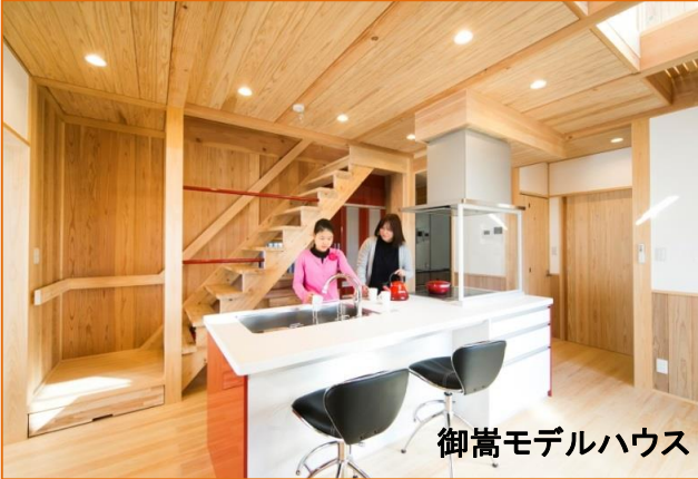
御嵩モデルハウス