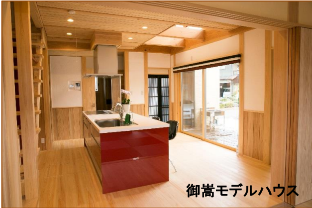
御嵩モデルハウス